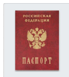
Страница паспорта с данными о регистрации родителя или свидетельство о временной регистрации