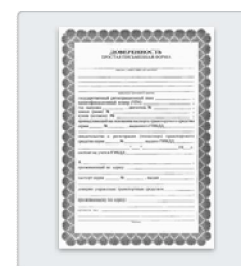
Если вы не родитель — доверенность или другой документ, подтверждающий право предоставлять интересы ребенка