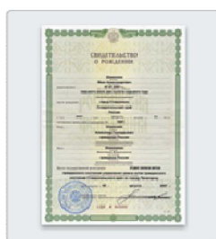
Свидетельство о рождении ребенка